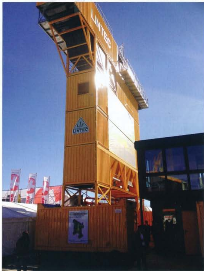
带底置式成品仓的CSD1510型沥青混凝土搅拌站

在2013年4月15~21日德国慕尼黑宝马展上，林泰阁集团展出了多款新品，旨在推进全球机械施工的绿色环保理念。林泰阁集团近百年来致力于沥青及水泥混凝土机械的研发与生产，其产品以拆装、运输便捷著称；近年来，林泰阁集团在其产品原有理念的基础上着重进行产品低能耗、新能源替代方面的研发。此次宝马展新品发布会展示了以下产品。