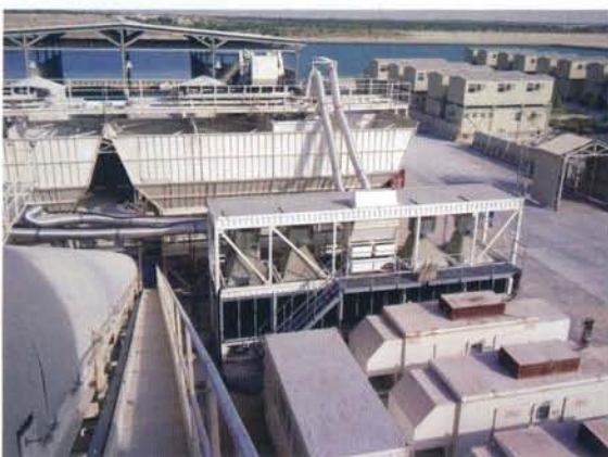
沙特阿拉伯工地上的ACS骨料冷却系统