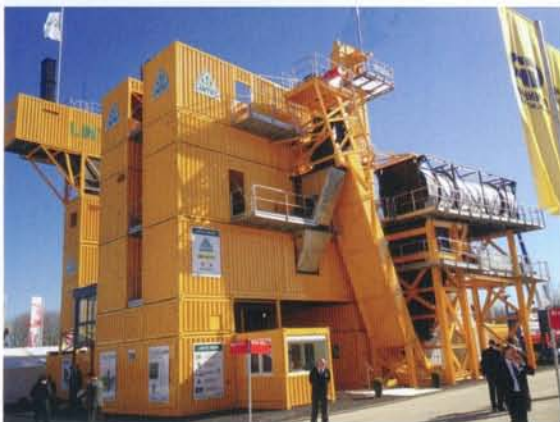
配套冷热再生系统的CSM2500型沥青混凝土搅拌站